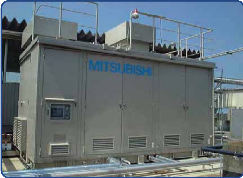
排水処理場から発生する メタンガスを利用した 燃料電池発電設備 (キリンビール)