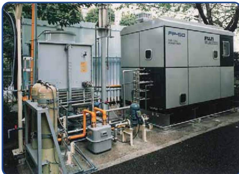
バイオガス利用の PAFC （鹿島建設）