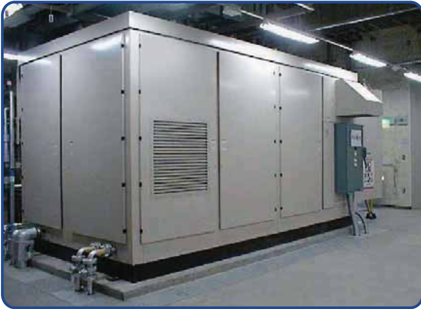
マルチ燃料型燃料電池（NTT）