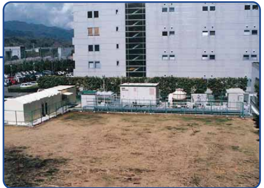
名古屋栄ワシントンホテルに 適用の PAFC (東邦ガス)