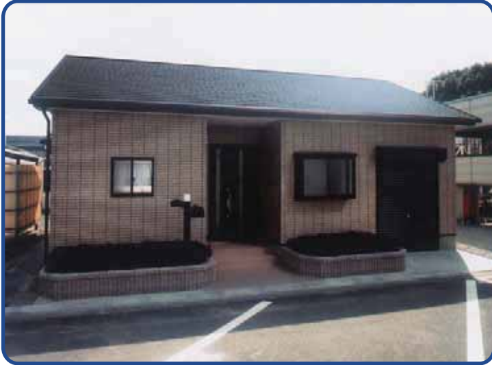
家庭用1kW PEFC実験住宅 (東邦ガス)