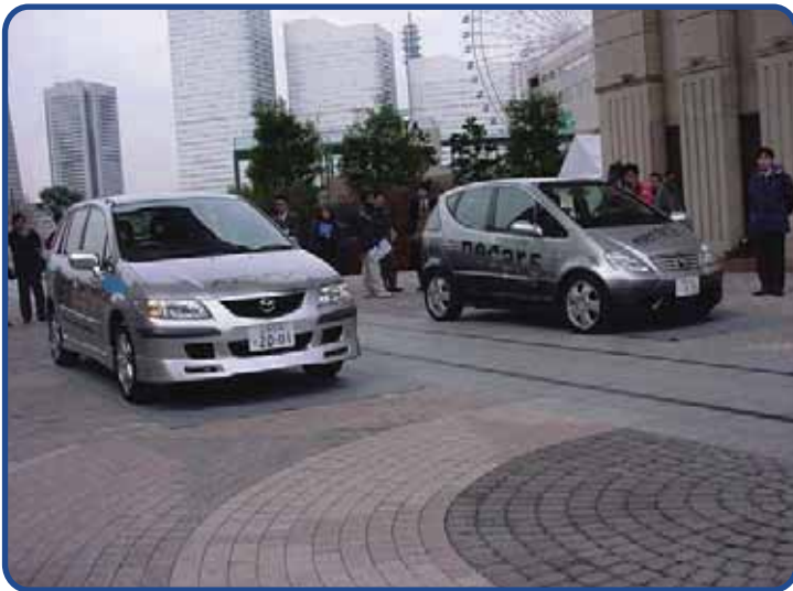
本邦初の燃料電池自動車の 公道試験 (日石三菱)